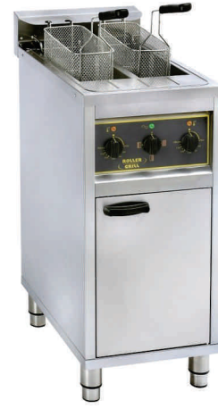
RF 20 C