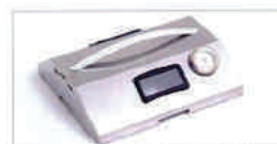
COUVERCLE DE CUISSON À L'ÉTOUFFÉE STEAMED COOKING LID (DAS3176)