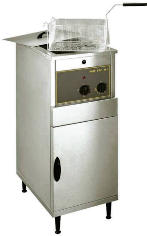
RF 14/25 S