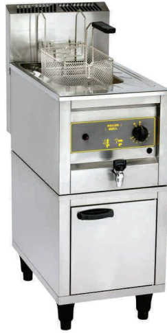
RFG 12 + MS